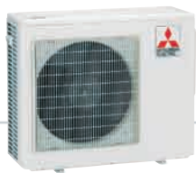
2 PUERTOS MXZ-2B30VA / MXZ-2B40VA MXZ-2B52VA

No se puede conectar con MXZ-2A30VA / 2A40VA / 2A52VA / 3A54VA / 4A71VA / 4A80VA / 5A100VA La conexión simple 1:1 no es posible.