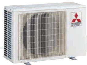
3 Y 4 PUERTOS MXZ-3B54VA / MXZ-3B68VA MXZ-4B71VA