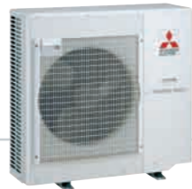
4 Y 5 PUERTOS MXZ-4B80VA / MXZ-5B100VA