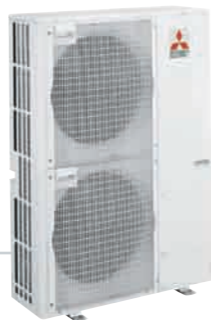
8 PUERTOS MXZ-8A140VA