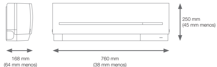
Comparación con GE

La elegante unidad interior con acabados cuadrados añade un toque de clase al interior de cualquier habitación. Su diseño compacto es 64 mm más delgado que nuestra anterior unidad interior con la menor capacidad de salida (MSZ-GE22VA)